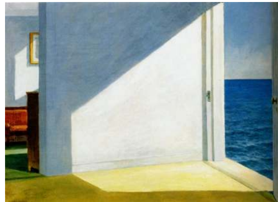
Edward Hopper - Rooms by the sea - 1951

Quelles sont les étapes de création d'un tableau ? A quel moment considérez-vous que le tableau est achevé ?