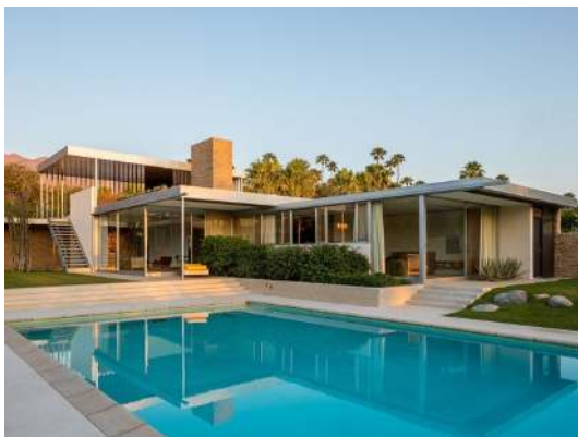
Richard Neutra - Kaufmann Desert House - Palm Springs, 1946

Ce n'est que plus tard que l'univers californien s'est imposé comme une évidence dans ma pratique, en découvrant la peinture de David Hockney et d'Edward Hopper, les photographies d'Ed Ruscha et de Julius Schulman, ainsi que tout le mouvement architectural moderniste américain des années 50.